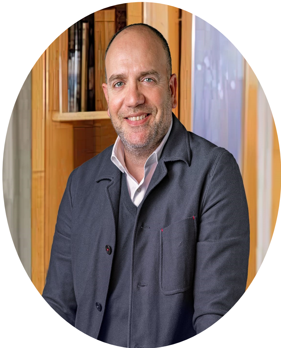
Arqueha - Servicios de Arquitectura