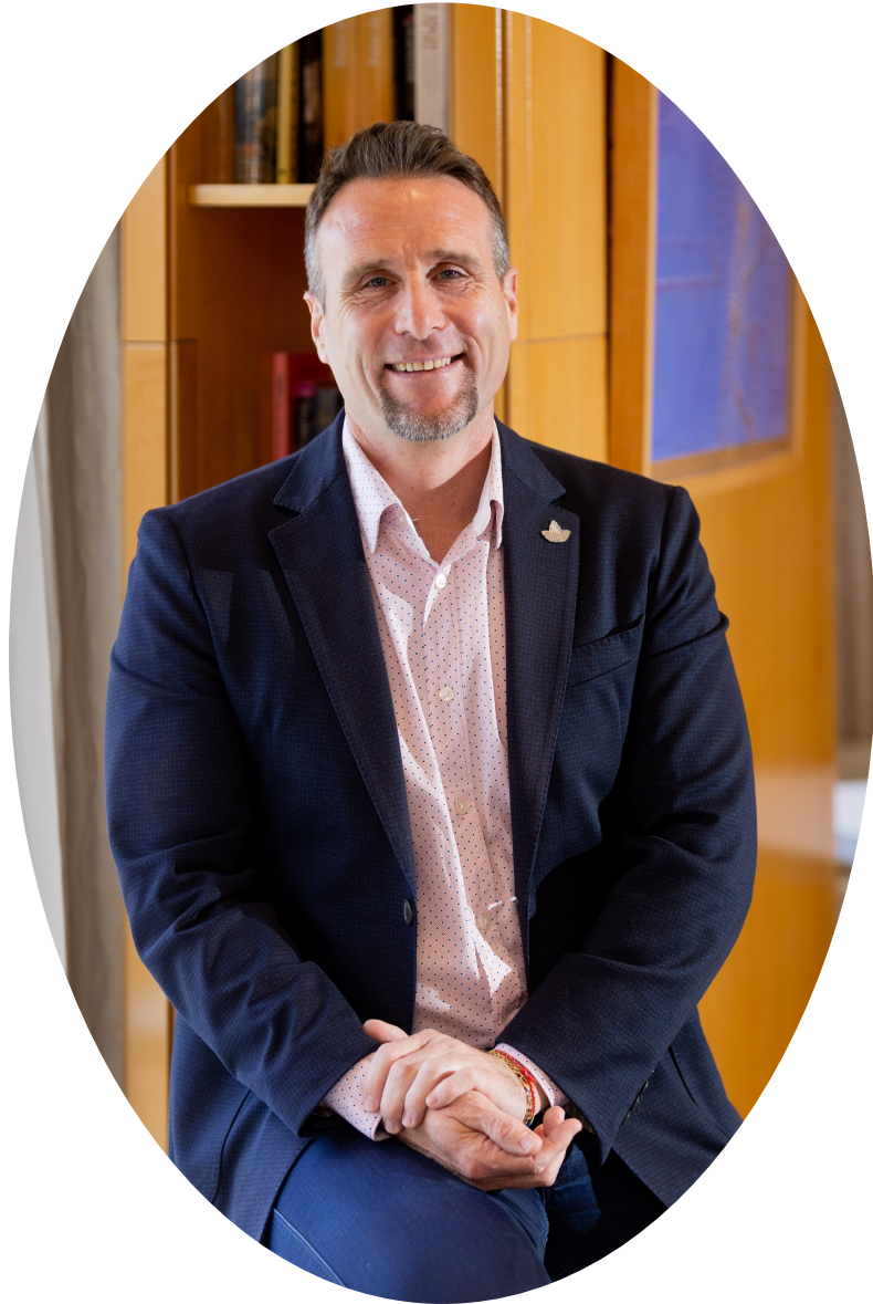
Heura | Consultoría medioambiental