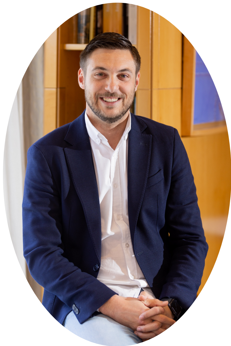
Adequip - Inicio